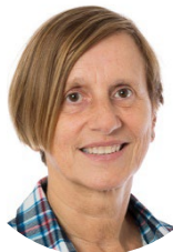
Florence Lassarade Sénatrice (LR) de la Gironde