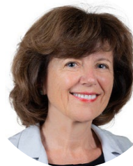
Laurence Muller-Bronn Sénatrice (app. LR) du Bas-Rhin