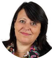
Anne-Sophie Romagny Sénateur (UC) de la Marne