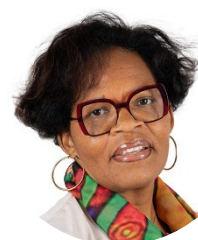
Solanges Nadille Sénatrice (RDPI) de la Guadeloupe