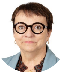
Corinne Féret Sénatrice (SER) du Calvados