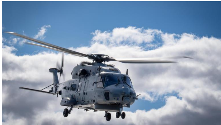
La disponibilité du NH90 Caïman reste un point noir

globalement saluée, ainsi que les capacités de maintenance en mission développées par la Marine nationale. La disponibilité des avions de chasse de la Marine nationale sera en revanche nécessairement impactée par la mise au standard F4 du Rafale. Par ailleurs, le NH90 Caïman reste un point noir. L'hélicoptère a souffert de la corrosion saline et d'un soutien industriel fragile avec un manque de pièces de rechange, malgré les efforts du Service industriel de l'aéronautique (SIAé) qui a augmenté ses capacités d'entretien de cet hélicoptère ainsi qu'un engagement accru des industriels sur la disponibilité de certaines pièces. Lorsqu'il est en pleine possession de ses capacités, il s'agit pourtant d'un appareil très performant dont la complémentarité avec les frégates fait l'objet de tous les éloges, notamment en lutte anti sous-marine. Cette question de la disponibilité du NH90 doit donc continuer à concentrer tous les efforts, car ce matériel doit fonctionner encore au moins 20 ans.