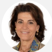
Dominique Estrosi Sassone Présidente Sénateur des Alpes-Maritimes (Les Républicains)