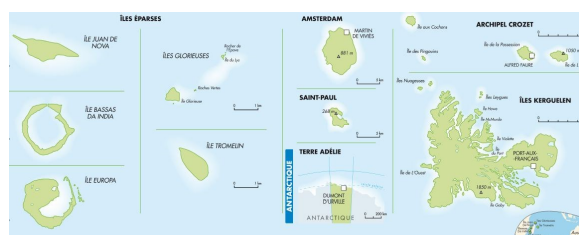
Les Terres australes et antarctiques françaises