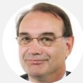
Dominique de Legge Président Sénateur d'Ille-et-Vilaine (LR)