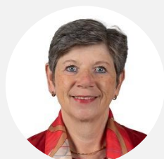
Catherine DI FOLCO Sénatrice du Rhône (LR)