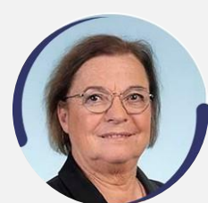
Caroline COLOMBIER Députée de Charente (3 e circonscription) (RN)