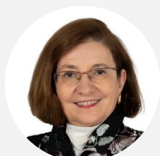
Gisèle JOURDA Sénatrice de l'Aude (SOC)