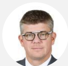
Cédric PERRIN Président de la commission des affaires étrangères, de la défense et des forces armées Sénateur du Territoire de Belfort (LR)