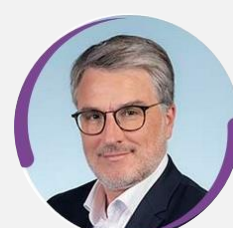
Florent BOUDIÉ Président de la commission des lois Député de Gironde (10 e circonscription) (EPR)