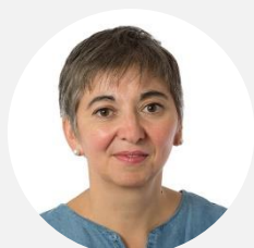
Muriel JOURDA 1 er Vice-Président Président de la commission des lois Sénateur du Morbihan (LR)