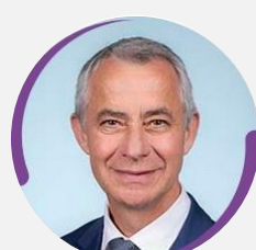
Jean-Michel JACQUES Président Président de la commission de la défense et des forces armées Député du Morbihan (6 e circonscription) (EPR)