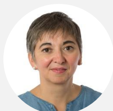
Muriel JOURDA Président de la commission des lois Sénateur du Morbihan (LR)