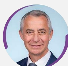
Jean-Michel JACQUES 1 er Vice-Président Président de la commission de la défense et des forces armées Député du Morbihan (6 e circonscription) (EPR)