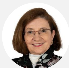
Gisèle JOURDA Vice-présidente Sénatrice de l'Aude (SOC)