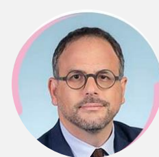
Aurélien ROUSSEAU Député des Yvelines (7 e circonscription) (SOC)