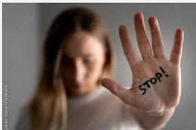
Table ronde sur l'expertise psychiatrique et psychologique des délinquants sexuels