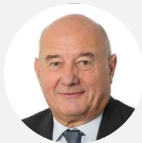
Serge Babary Rapporteur

Sénateur des Yvelines ( Les Républicains )