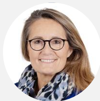
Sophie Primas Présidente

Sénateur des Yvelines ( Les Républicains )