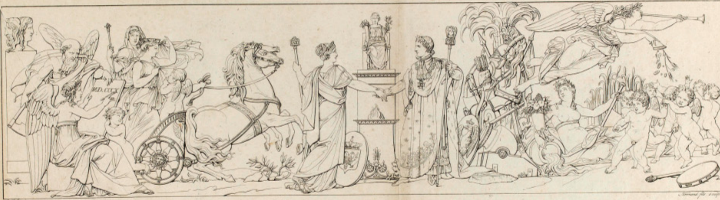
ALLIANCE DE LEURS MAJESTES