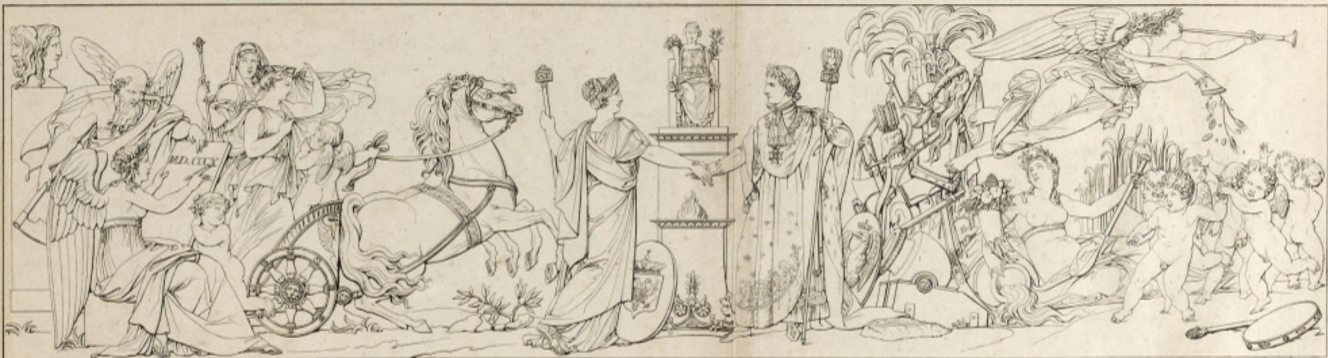
ALLIANCE DE LEURS MAJESTÉS