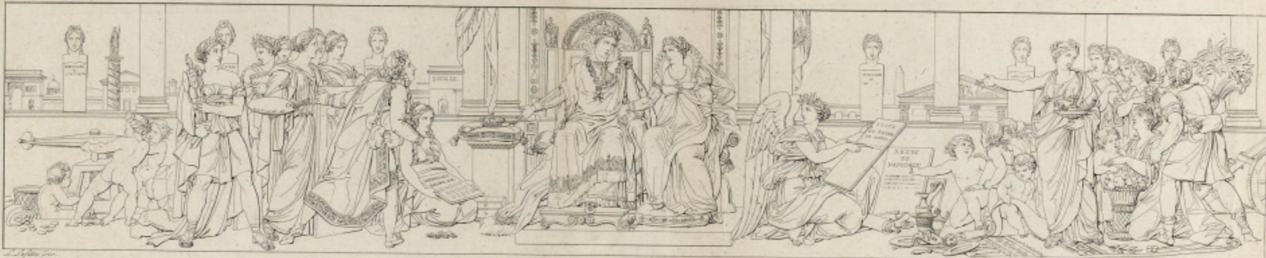
PROSPÉRITÉ DE L'EMPIRE