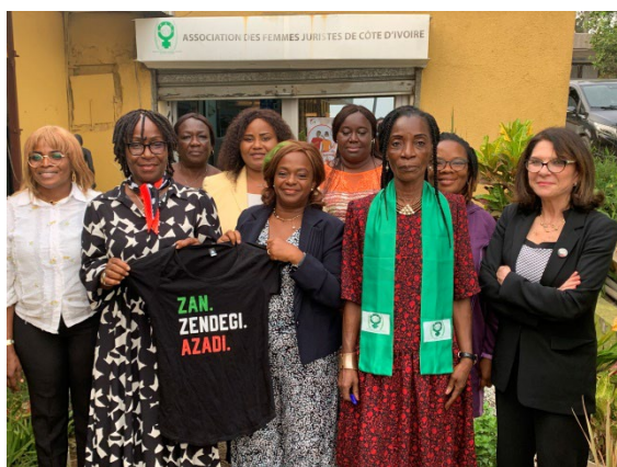
Le Bureau de l'Association des femmes juristes de Côte d'Ivoire

Cet apaisement politique permet aux excellentes relations franco-ivoiriennes 2 de se recentrer sur des enjeux essentiels. C'est le cas de la valorisation de messages à destination de la jeunesse ivoirienne (entrepreneuriat, formation professionnelle, sport, industries culturelles et créatives, etc.), alors que 400 000 jeunes entrent chaque année sur le marché du travail. C'est aussi le cas du partenariat économique – la Côte d'Ivoire est le deuxième marché français en Afrique subsaharienne (présence de près de 800 entreprises françaises, dont de grandes, mais aussi de nombreuses PME, projets d'infrastructures relatifs au métro et à l'aéroport, la France premier bailleur bilatéral, etc.). En revanche, la coopération décentralisée marque le pas et gagnerait à être relancée.