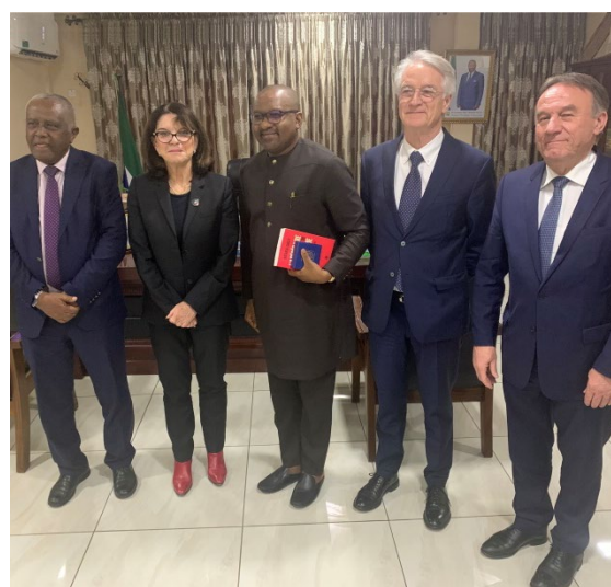
La délégation avec M Mohamed Juldeh Jalloh, Vice-Président de la République de Sierra Leone

Depuis son élection en 2018, et dans le contexte du Brexit, le Président Bio affiche sa volonté de nouer des relations privilégiées avec la France et d'en faire son partenaire européen principal . L'entretien des Présidents Macron et Bio, en 2019, a donné une nouvelle impulsion à la relation bilatérale : réouverture d'une antenne diplomatique française à Freetown en octobre 2020 et création d'un guichet de dépôt de demande de visas en son sein, réintroduction progressive de l'enseignement du français, avec le projet de réouvrir une Alliance française. La Sierra Leone pourrait, quant à elle, implanter une ambassade à Paris.