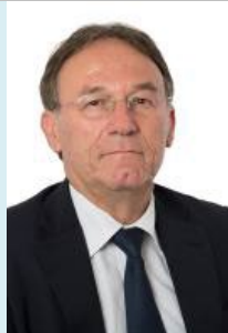
M. Patrice JOLY Président délégué du groupe pour la Sierra Leone Sénateur de la Nièvre (Socialiste, Écologiste et Républicain)