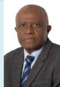
M. Abdallah HASSANI Vice-président du groupe Sénateur de Mayotte (Rassemblement des démocrates, progressistes et indépendants)

Composition du groupe d'amitié : http://www.senat.fr/groupe-interparlementaire-amitie/ami_573.html