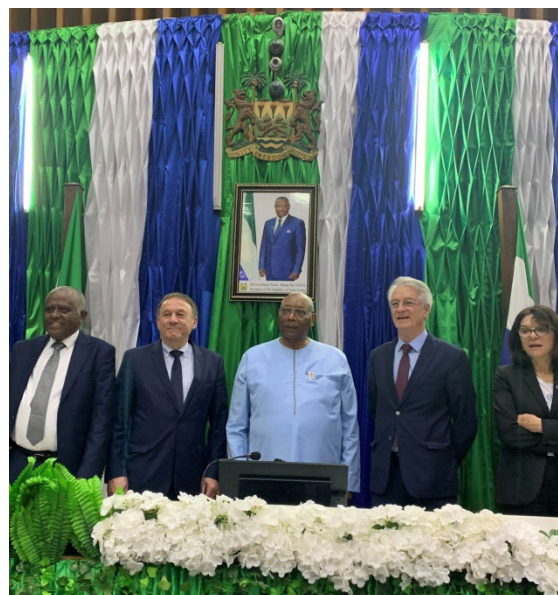
La délégation avec M. Abass Bundu, Président du Parlement de Sierra Leone

Côte d'Ivoire et le Liberia, l'un des trois pays d'Afrique de l'Ouest à avoir voté en faveur des trois résolutions sur la guerre en Ukraine à l'Assemblée générale de l'ONU.