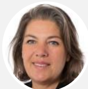
Sonia de LA PROVÔTÉ

Rapporteur Sénateur des Bouches-du-Rhône (CRCE - Kanaky)