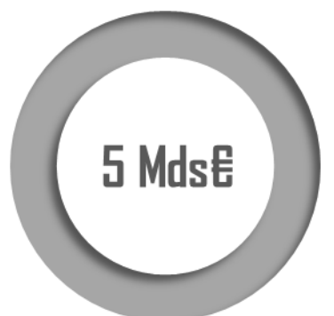
De crédits d'entretien programmé des matériels en 2023

La nouvelle LPM 2024-2030 prévoit que 49 milliards d'euros seront consacrés à l'entretien programmé des matériels (EPM) . Pour 2024, la LFI prévoit que ces crédits atteindront 5,74 milliards d'euros pour l'ensemble des armées, soit une hausse de 15%, +745 milliards d'euros par rapport à la LFI 2023 . Ces montants doivent toutefois être relativisés. En 2019, la précédente LPM évaluait à 6,5 milliards d'euros le besoin en EPM pour 2024. Ainsi le présent PLF pour 2024 prévoit en réalité 800 millions d'euros de moins que ce qui était inscrit pour la même année par la précédente loi de programmation, et ceci alors même qu'il faut tenir compte de l'inflation.