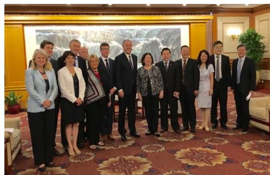
La délégation sénatoriale au Palais du Peuple de Shenzhen