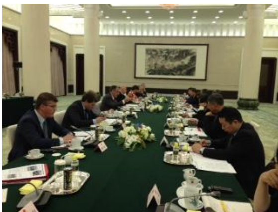
6 e session du mécanisme d'échanges à l'Assemblée nationale populaire (Pékin)

Au cours de la session des échanges interparlementaires franco-chinois du 6 juillet, MM. Li Lihui et Chong Quan, députés, sont intervenus sur le thème de « l'économie de marché et la Chine ».