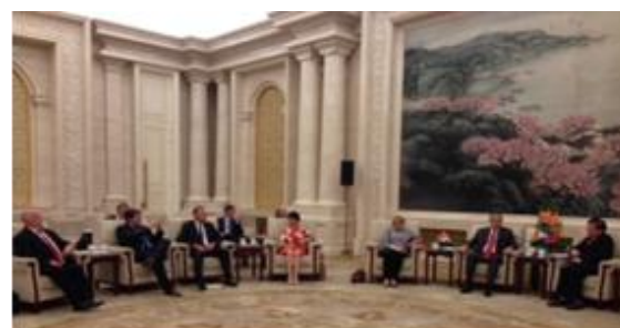
Audience de courtoisie accordée à la délégation sénatoriale par M. Chen Zhu, Vice-président du comité permanent de l'ANP

M. Chen Zhu, Vice-président du comité permanent de l'APN a accordé une audience exceptionnelle aux sénateurs. Il a évoqué les grands défis auxquels la Chine devait faire face dans les années à venir, notamment à l'occasion de la préparation de la tenue du 19 e Congrès du Parti communiste chinois en 2017. La délégation a visité le Palais du Peuple et, notamment la salle des séances et du comité permanent de l'ANP.