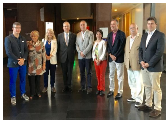
La délégation sénatoriale à l'Ambassade de France

Accueillie à son arrivée, le 5 juillet, à Pékin, par le groupe d'amitié Chine - France de l'Assemblée nationale populaire, la délégation s'est ensuite entretenue avec M. Maurice Gourdault-Montagne, Ambassadeur de France en Chine, de l'actualité des relations bilatérales.