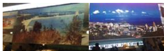
Shenzhen en 1984 (gauche) et 2012 (droite)

La délégation sénatoriale a visité la zone économique spéciale de Shenzhen, ancien village de pêcheurs qui ne comptait en 1984 que moins de 30 000 habitants et dont la population s'élevait en 2012 à plus de 10 millions. Les photographies présentées au musée de la ville illustrent ce phénomène.