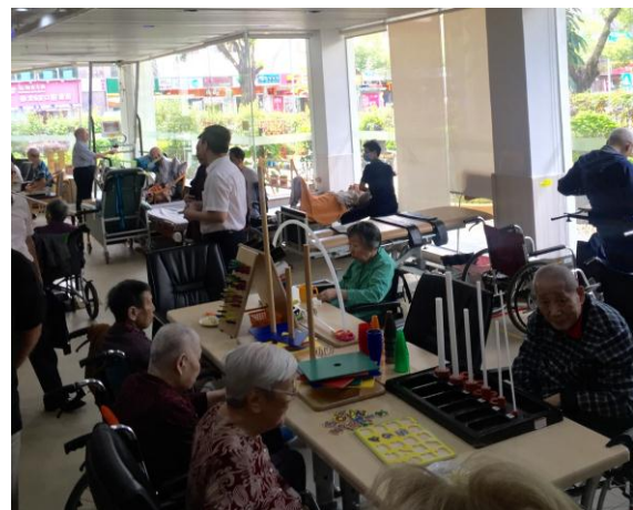
La délégation sénatoriale dans une maison de retraite à Shenzhen