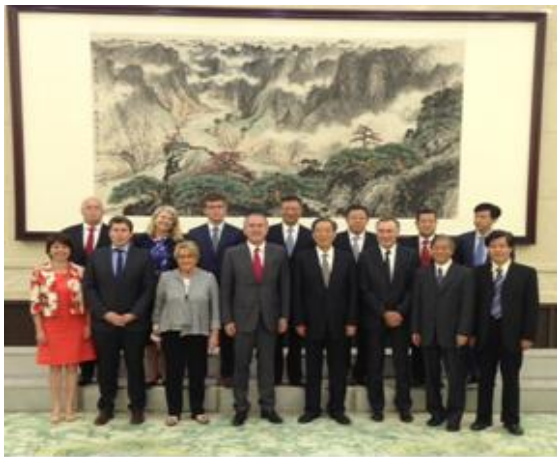
La délégation sénatoriale reçue à l'Assemblée nationale populaire de Pékin

Depuis six ans, une session de travail réunit chaque année, alternativement en France et en Chine, des parlementaires des deux pays, autour de thématiques telles que la gestion du patrimoine, l'hôpital public, la médecine de proximité, les petites et moyennes entreprises (PME), le développement durable, les relations diplomatiques, etc.